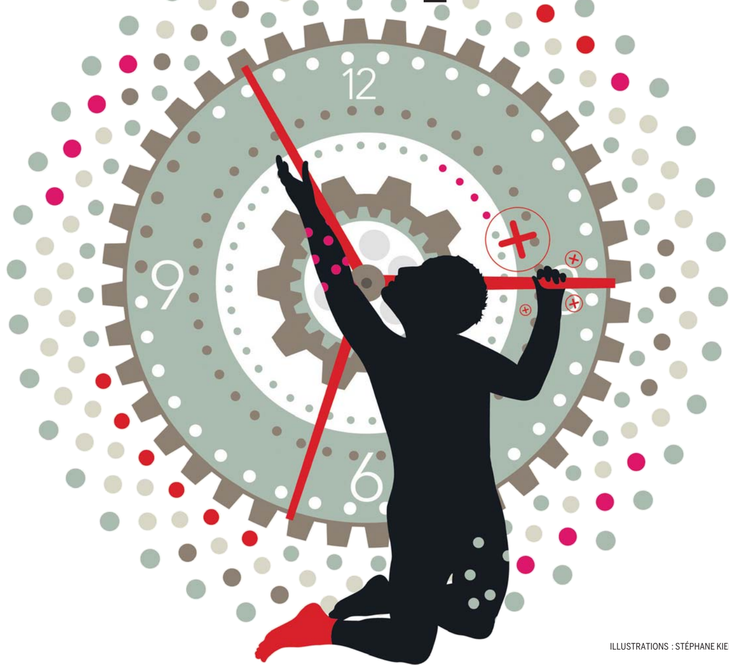
ILLUSTRATIONS : STÉPHANE KIEHL