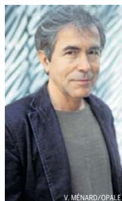
Le philosophe François Jullien prononcera la leçon inaugurale